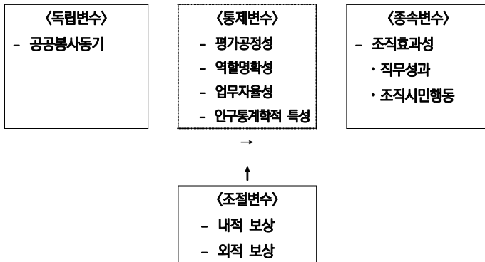
<그림 1> 연구모형

이상의 논의를 종합하여 본 연구에서는 가설의 검증을 위해 종속변수로서 조직 효과성의 개인적인 측면인 직무성과와 조직적인 측면인 조직시민행동을, 독립변수로서 공공봉사동기, 조절변수로서 외적 보상과 내적 보상 등을 선정하여 아래의 <그림 1>과 같이 인과모형을 구성하였다. 아울러 통제변수로서 평가공정성, 역할명확성, 업무자율성 그리고 설문조사에서 수집된 응답자들의 인구통계학적 특성들을 포함하였다.